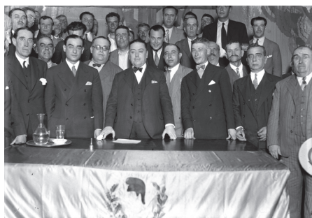
La Bandera en un mitin de Martínez Barrio en el Teatro del Duque de Sevilla el 26 de junio de 1936.

elección de la "Señorita República Radical", abril de 1933