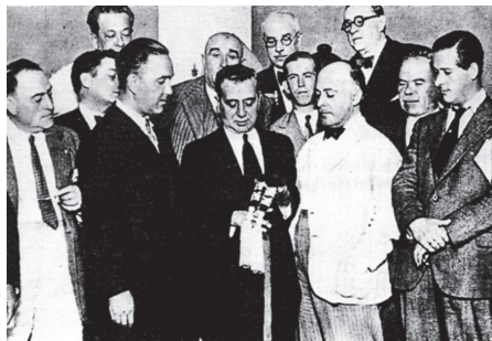
La Bandera con el fajín de Sanjurjo abandonado en su huida tras el golpe de Estado del 10 de julio.