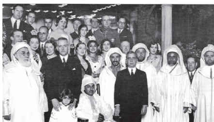
Fiesta andaluza en el Hotel Madrid con motivo de la visita del Jalifa Muley el Moheddi a Sevilla el 21 de mayo de 1932. Le acompañan el gobernador y el alcalde de la ciudad, González Fernández de la Bandera