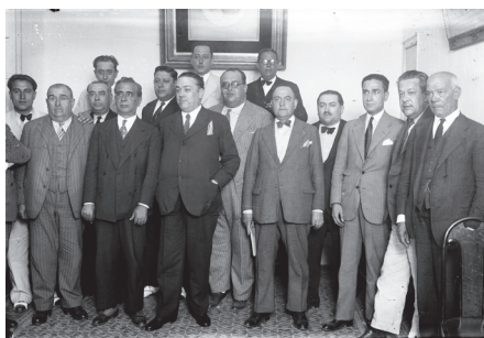
La Bandera en una reunión con los concejales del partido Radical del Ayuntamiento, 9 de septiembre de 1931.