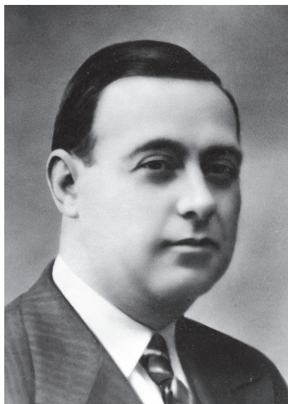
Juan Lozano Ruiz

En las elecciones de febrero de 1936 se postuló como candidato a Cortes por el PSOE dentro de la candidatura conjunta del Frente Popular por Jaén, siendo elegido diputado con 137.690 votos 91 . Fue vocal de la comisión de Agricultura.