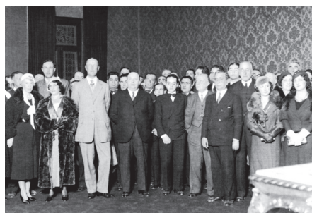
Fernández de la Bandera el tercero por la izquierda y el cuarto por la derecha Indalecio Prieto, junto a autoridades y personalidades destacadas de la ciudad. Visita a Sevilla, en febrero de 1933, del ministro de Obras Públicas Indalecio Prieto