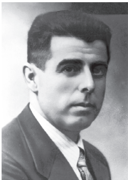
Antonio Bujalance López