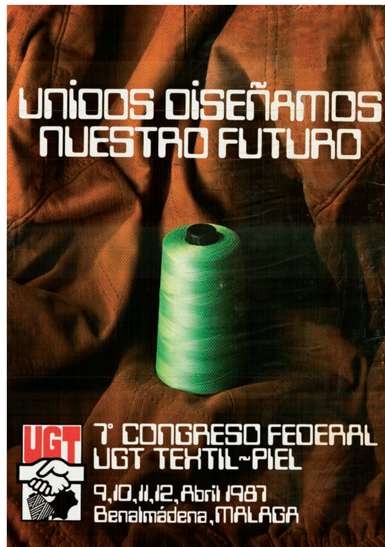
■ Cartel del VII Congreso Federal de UGT Textil-Piel AHUGT-A

Al cierre de esta edición no podemos ofrecer la composición de la Comisión Ejecutiva elegida en este Congreso.