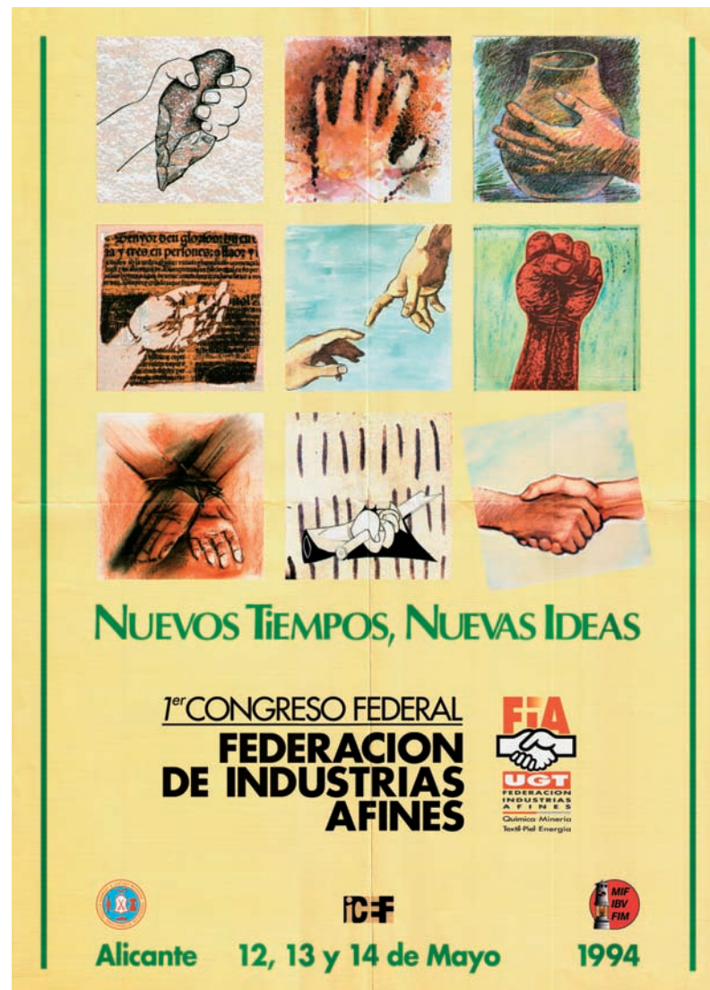
■ Cartel del I Congreso de la Federación de Industrias Afines AHUGT-A