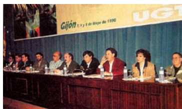
II Congreso de FIA, celebrado en Gijón, del 7 al 9 de mayo de 1998 AHUGT-A

La FIA celebrará su primer congreso en mayo de 1994, integrando cuatro sectores de producción, Químico, Energético, Textil-piel y Minero.