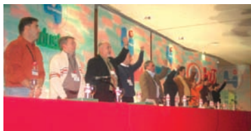
Comisión Ejecutiva de FIA elegida en el Congreso UGT

Santander, 10, 11 y 12 de noviembre de 2005