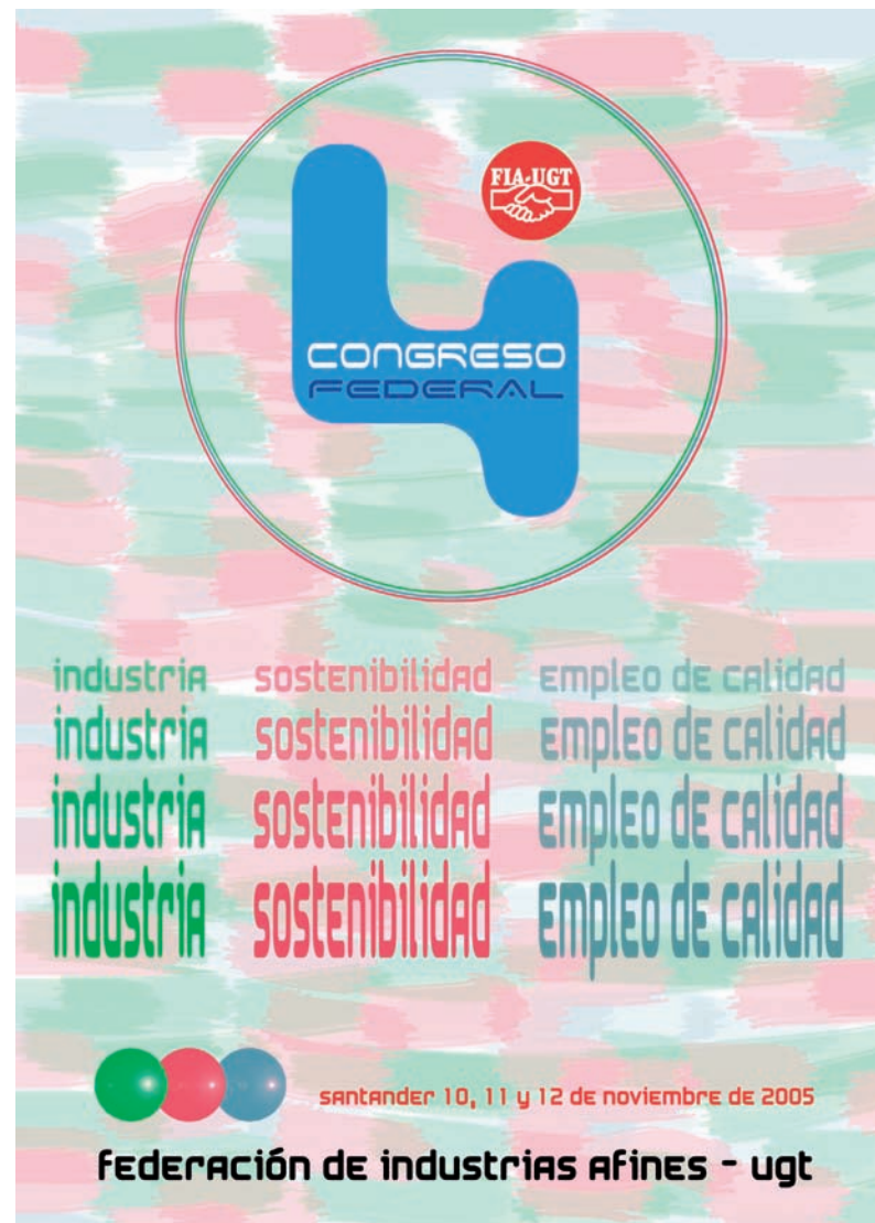
Cartel del IV Congreso de FIA AHUGT-A

Publicación de FIA sobre Prevención de Riesgos Laborales en el sector Textil-Confección AHUGT-A