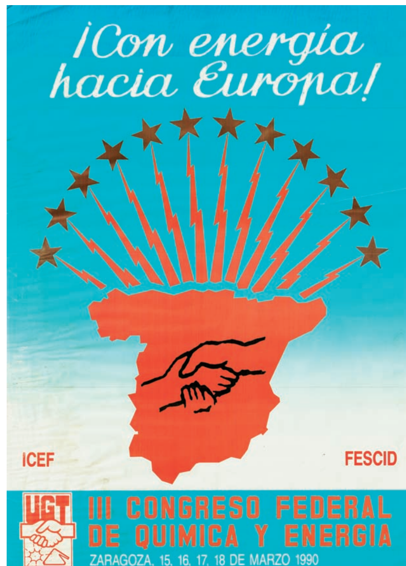
■ Cartel del III Congreso Federal de Química y Energía AHUGT-A

Al cierre de esta edición no podemos ofrecer la composición de la Comisión Ejecutiva elegida en este Congreso.