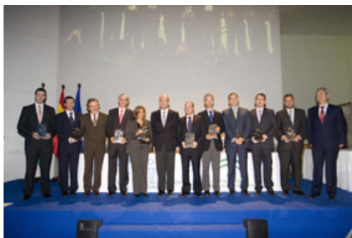
Premiados en los II Premios Sociedad de la Información Andaluza