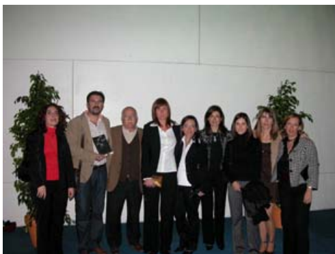
Personal de la Biblioteca Digital sobre Migraciones e Interculturalidad en la entrega de Premios

En esta II Edición los ganadores han sido: