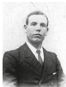
Fuelle: Todos los nombres

Benito Cordobés Herencia . Nacido en Castro del Río en 1884. Comenzó su andadura política de la mano del anarcosindicalismo con una fuerte convicción en el poder de la educación como instrumento de liberación campesina. Fue un activo propagandista en los primeros años del siglo XX. A partir de 1918 comienza un periodo de replanteamiento de sus posturas políticas y de reflexión, que se tradujo en un giro hacia el socialismo, comenzando a militar en la UGT. En estos años preside la Unión de Izquierdas de Espejo y la Sociedad Obrera Socialista. Tras el golpe militar es apresado y retenido durante días en Espejo, su lugar de residencia. Una semana después aproximadamente lo trasladan a la cárcel de Montilla. Aunque no hay constancia de ello, se cree que fue uno de los fusilados junto al arroyo Carchena en la madrugada del 6 al 7 de agosto de 1936. Sus restos mortales se encuentran en la finca de Monterrite, en Castro del Río, según aseguran algunos testigos. ( fuelle: Todos los nombres )