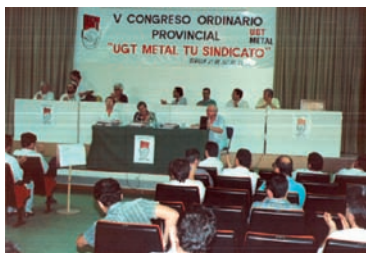
Mesa del Congreso AHUGT-A