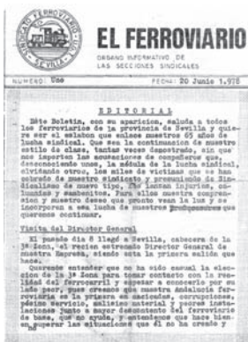
“El Ferroviario”, Órgano informativo de las Secciones Sindicales del Sindicato Ferroviario UGT de Sevilla n° 1, de 20 de junio de 1978 AHUGT-A

La Ejecutiva de la Federación Provincial elegida en este Congreso estaría constituida por: