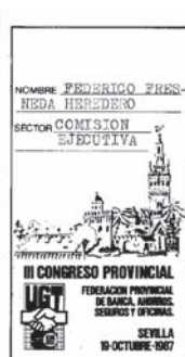
Credencial al Congreso del Secretario de Organización de la Comisión Ejecutiva de FEBASO AHUGT-A