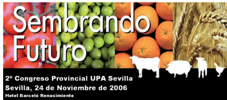
■ Cartel del II Congreso de UPA Sevilla AHUGT-A