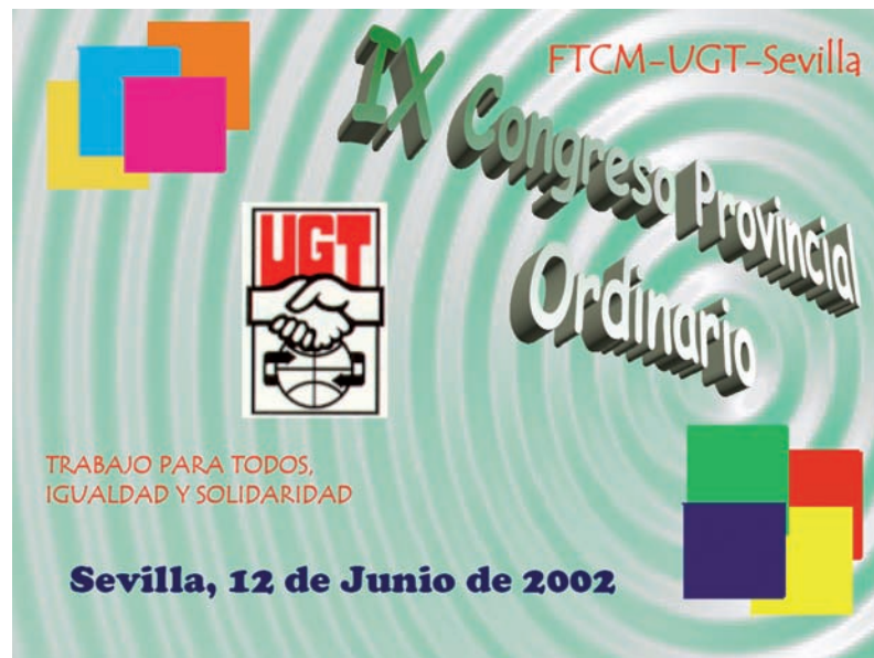
■ Cartel del IX Congreso Provincial de FTSM Sevilla AHUGT-A