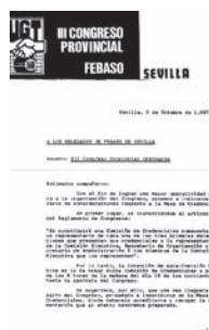
Circular del Secretario de Organización de FEBASO sobre la Mesa de Credenciales del Congreso AHUGT-A

A mediados de noviembre de 1983 se produce en Sevilla la fusión de las Federaciones Provinciales de Banca y Ahorro, y de Seguros y Oficinas, en una nueva Federación, la FEBASO.