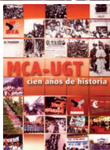
Panel y Programa de actos de la Exposición celebrada en Sevilla por MCA con motivo del Centenario de la Federación (1903-2003), del 18 al 27 de noviembre de 2003