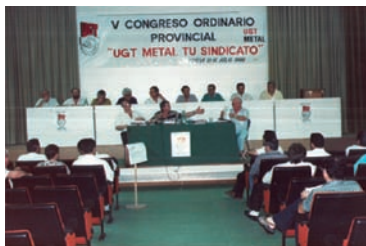
Sala del Congreso AHUGT-A

Al cierre de esta edición no podemos ofrecer la Comisión Ejecutiva elegida en este Congreso.