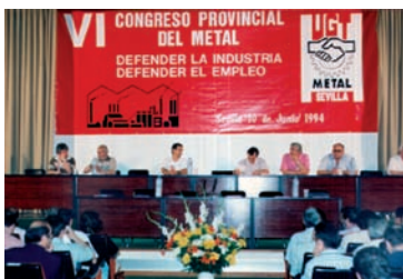
Mesa del Congreso AHUGT-A