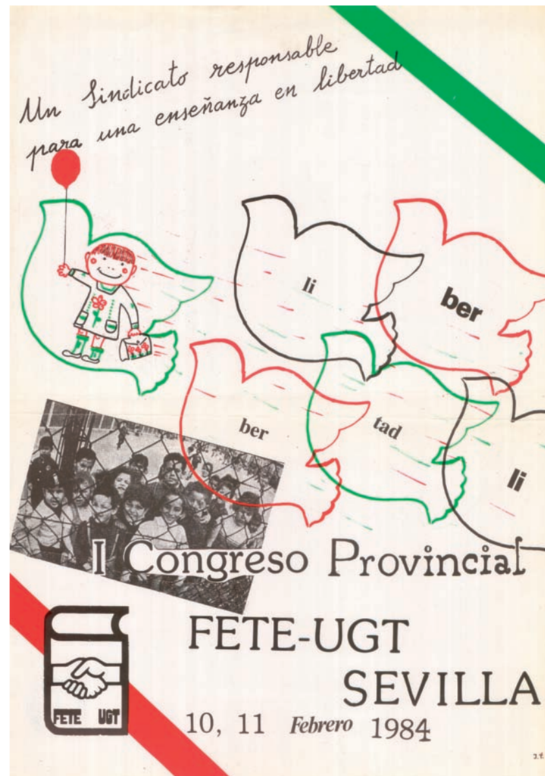
■ Cartel del I Congreso Provincial de FETE Sevilla