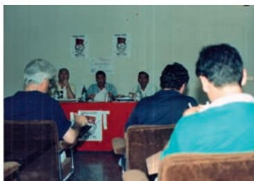
Reunión de trabajo del Congreso AHUGT-A