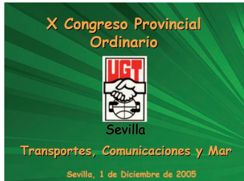
■ Cartel del X Congreso Provincial de FTSM Sevilla AHUGT-A