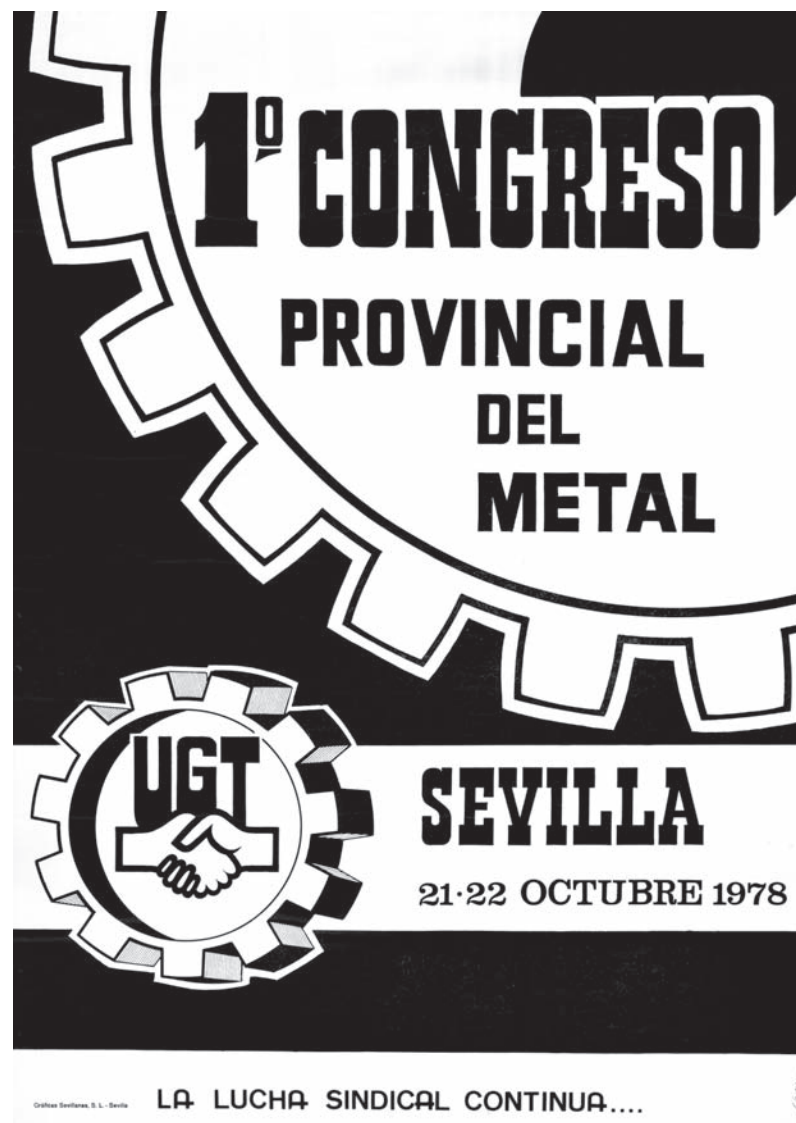
■ Cartel del I Congreso Provincial del Metal de Sevilla AHUGT-A Original en la FFLC

Al cierre de esta edición no podemos ofrecer la Comisión Ejecutiva elegida en este Congreso.