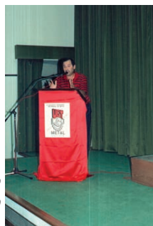
Intervenciones ante el Congreso AHUGT-A