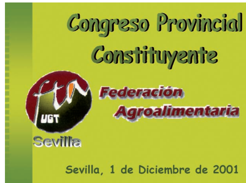
■ Cartel del Congreso Provincial Constituyente de FTA Sevilla AHUGT-A

Al cierre de esta edición no podemos ofrecer la Comisión Ejecutiva elegida en este Congreso.