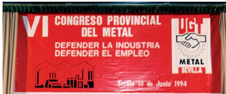
■ Imagen del VI Congreso Provincial del Metal de Sevilla AHUGT-A Reproducido a partir de una fotografía del frontis del Congreso