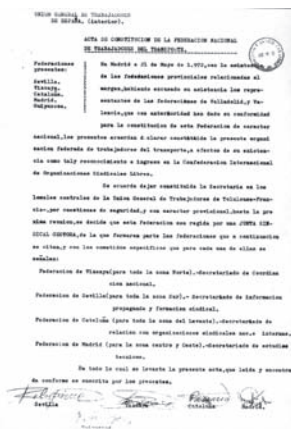
Acta de Constitución de la Federación Provincial de Trabajadores del Transporte de UGT (FNTT), en Madrid, el 21 de mayo de 1972, con presencia de la FP de Sevilla (firma con seudónimo de Robespierre), que asume la zona sur y la Secretaría de Información, Propaganda y Formación Sindical FFLC