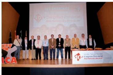
Comisión Ejecutiva elegida en el Congreso AHUGT-A