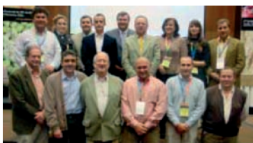
Comisión Ejecutiva de UPA Sevilla elegida en el Congreso AHUGT-A

La Ejecutiva de la Federación Provincial elegida en este Congreso estaría constituida por: