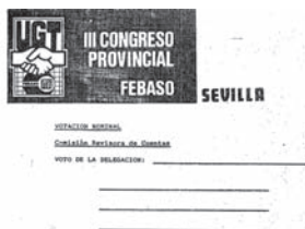
Papeleta de voto para el Congreso AHUGT-A