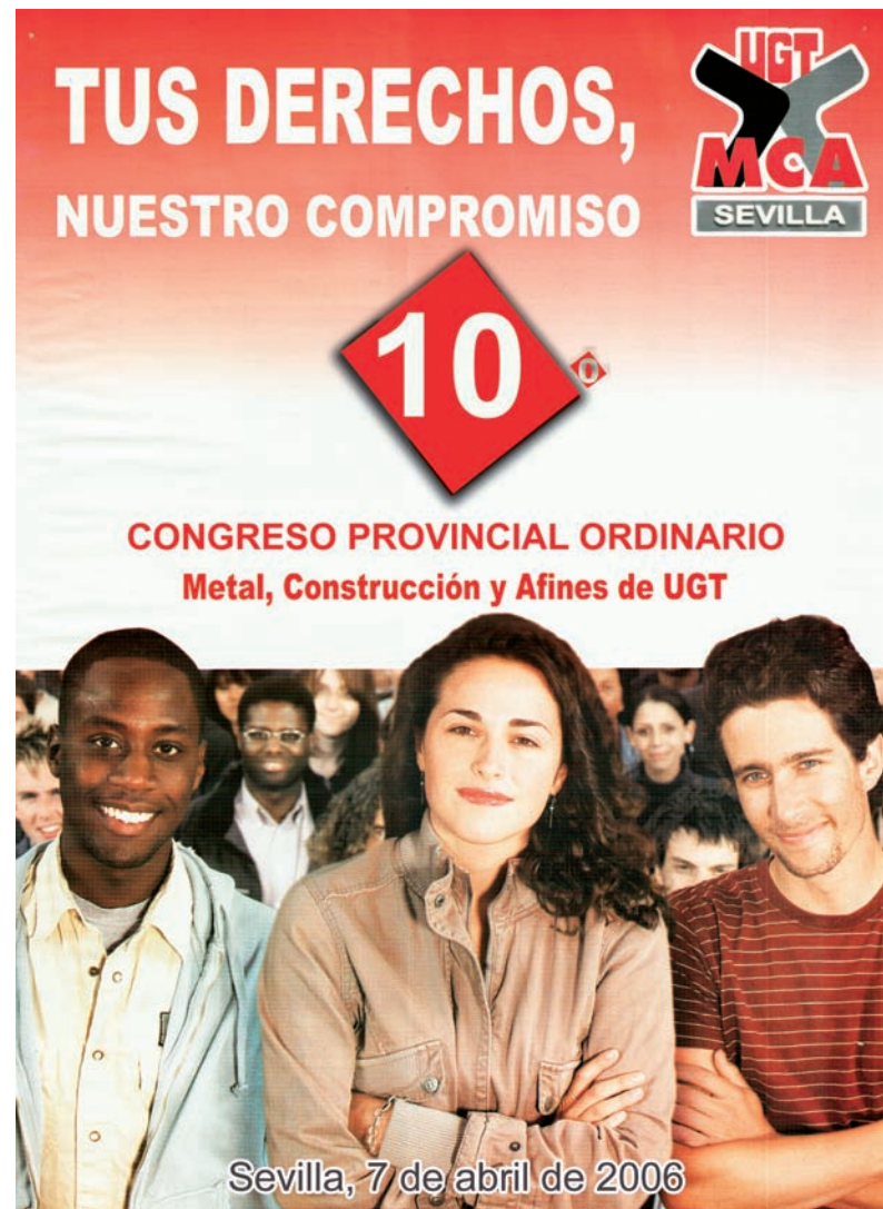
■ Cartel del X Congreso Provincial de MCA Sevilla AHUGT-A