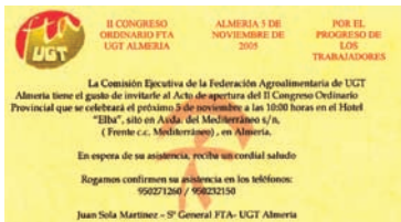
Invitación para el acto de apertura del II Congreso de FTA Almería AHUGT-A