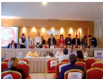
Imagen del Congreso AHUGT-A