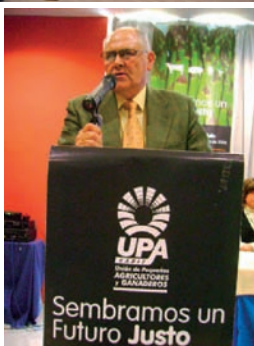
Imágenes del Congreso AHUGT-A