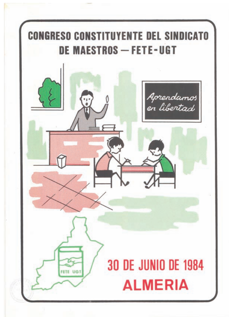
■ Cartel del Congreso Constituyente del Sindicato de Maestros FETE UGT Almería AHUGT-A. Original en la FFLC

Al cierre de esta edición no podemos ofrecer la Comisión Ejecutiva elegida en este Congreso.