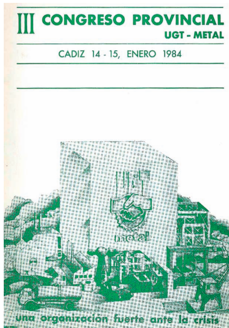
■ Cartel del III Congreso Provincial de UGT-Metal de Cádiz AHUGT-A

Al cierre de esta edición no podemos ofrecer la Comisión Ejecutiva elegida en este Congreso.