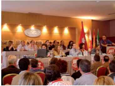
Imagen del Congreso AHUGT-A

La Ejecutiva de la Federación Provincial elegida en este Congreso estaría constituida por: