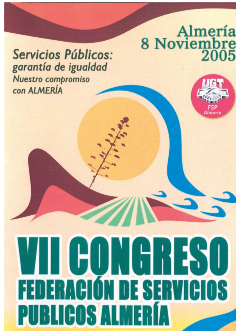
■ Cartel del VII Congreso de la Federación de Servicios Públicos de Almería AHUGT-A