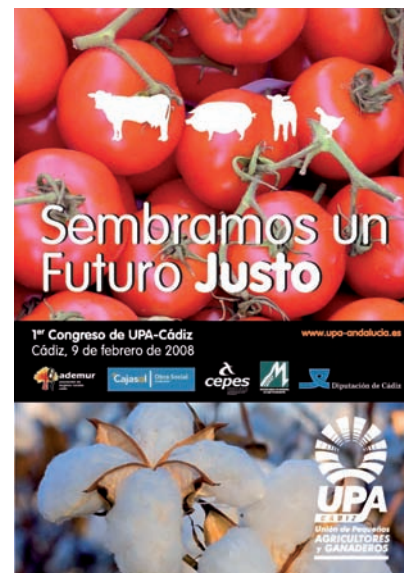
■ Carteles del I Congreso de UPA Cádiz AHUGT-A