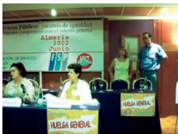
Imágenes del Congreso AHUGT-A

La Ejecutiva de la Federación Provincial elegida en este Congreso estaría constituida por: