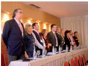
Nueva Comisión Ejecutiva elegida en el Congreso AHUGT-A