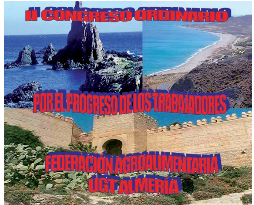
■ Cartel del II Congreso de la Federación Agroalimentaria de UGT Almería AHUGT-A