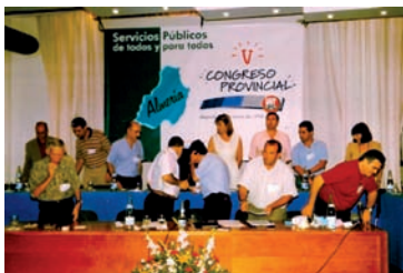
Imagen del Congreso AHUGT-A

La Ejecutiva de la Federación Provincial elegida en este Congreso estaría constituida por: