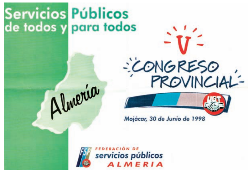
■ Cartel del V Congreso de la Federación de Servicios Públicos de Almería AHUGT-A