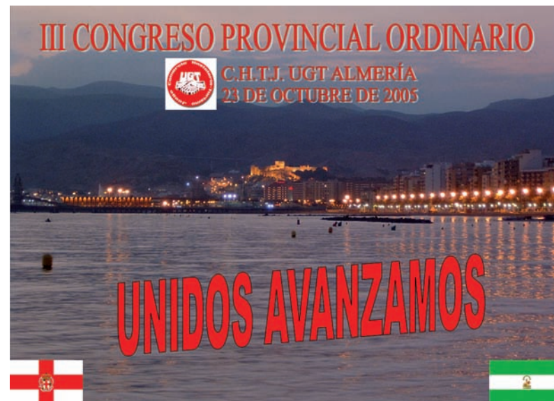
■ Cartel del III Congreso Provincial Ordinario de CHTJ UGT Almería AHUGT-A

Al cierre de esta edición no podemos ofrecer el conjunto de la Comisión Ejecutiva elegida en este Congreso.