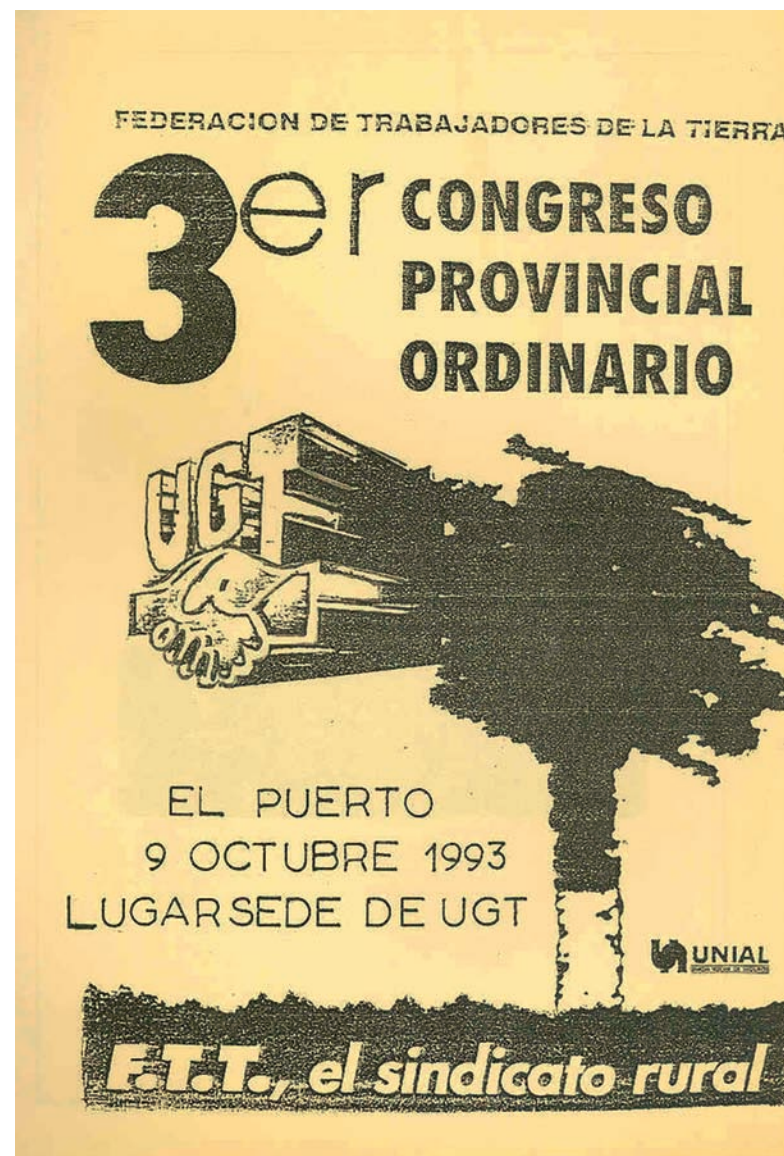
■ Cartel del III Congreso Provincial de la FTT de Cádiz AHUGT-A

Al cierre de esta edición no podemos ofrecer la Comisión Ejecutiva elegida en este Congreso.