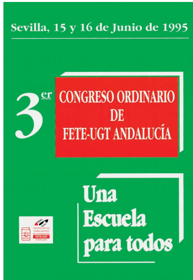
■ Cartel del III Congreso Ordinario de FETE-UGT Andalucía AHUGT-A