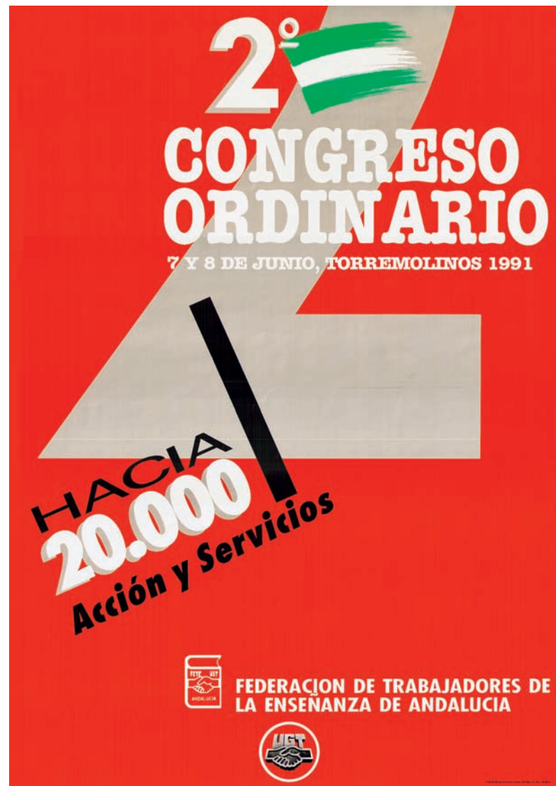
■ Cartel del II Congreso Ordinario de FETE-Andalucía AHUGT-A