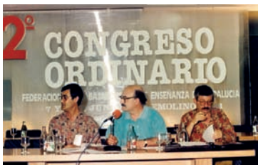
Detalle de la Mesa del Congreso AHUGT-A

Torremolinos (Málaga), 7 y 8 de junio de 1991