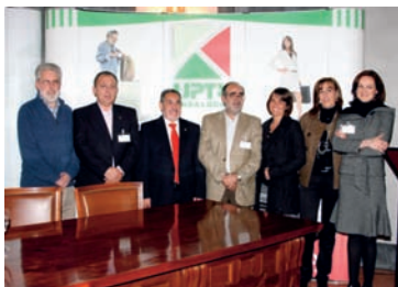
La nueva Comisión Ejecutiva, elegida en el II Congreso UPTA-Andalucía AHUGT-A

El 22 de febrero de 2008 tuvo lugar, en la Casa de la Provincia de Sevilla, la celebración del II Congreso de la Unión de Profesionales y Trabajadores Autónomos de Andalucía. En este Congreso fue elegida la siguiente Comisión Ejecutiva: