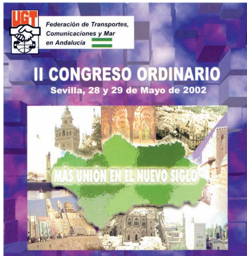
■ Cartel del II Congreso Ordinario de TCM-UGT Andalucía AHUGT-A