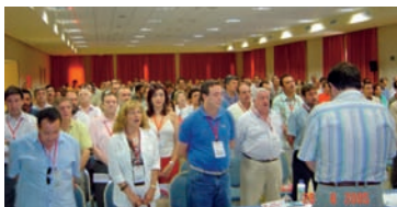
Delegados e invitados en la clausura del Congreso AHUGT-A