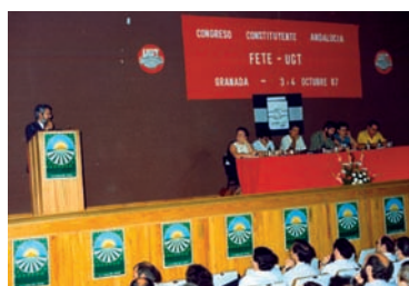
Momento de una de las intervenciones en el Congreso Constituyente de FETE-A AHUGT-A