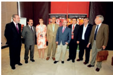
Invitados y delegados del Congreso AHUGT-A

El 5 de mayo de 2006 se celebraba en Sevilla el IV Congreso Regional de UPA Andalucía. En este Congreso saldría elegida la siguiente Comisión Ejecutiva: