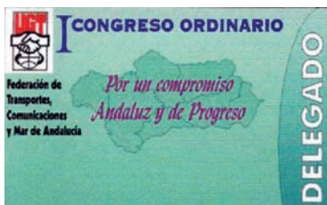
Credencial del Congreso AHUGT-A