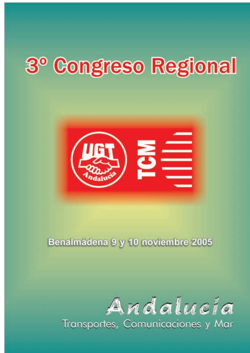
■ Cartel del III Congreso de TCM UGT-Andalucía AHUGT-A