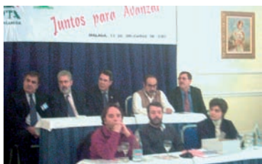
Mesa del Congreso AHUGT-A

El 13 de diciembre de 2003 tenía lugar el primer Congreso de la Unión de Profesionales y Trabajadores Autónomos de UGT Andalucía.