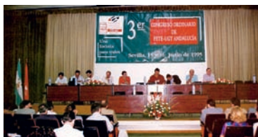
Vista general del salón de actos en el que se celebraba el III Congreso de FETE-A AHUGT-A