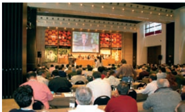
Vista general del Congreso AHUGT-A