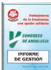
Informe de Gestión del V Congreso de FETE-A AHUGT-A

Será en 2002 cuando la Federación de Trabajadores de la Enseñanza de UGT-Andalucía celebre su V Congreso ordinario, eligiendo como componentes de la Comisión Ejecutiva a: