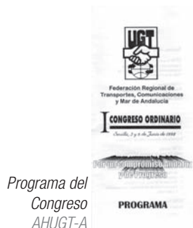
Programa del Congreso AHUGT-A

Reproducido a partir de la tarjeta de votación del Congreso