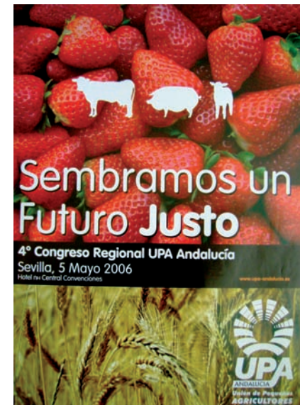
■ Carteles del IV Congreso Regional de UPA-UGT Andalucía AHUGT-A