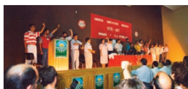
Clausura del Congreso AHUGT-A

El Congreso Constituyente de FETE-UGT Andalucía se celebraba en Granada, los días 3 y 4 de octubre de 1987.