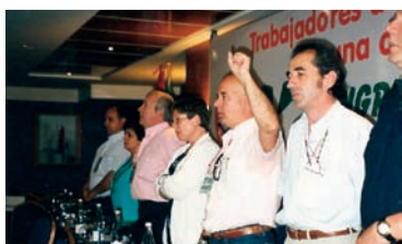
Clausura del Congreso AHUGT-A