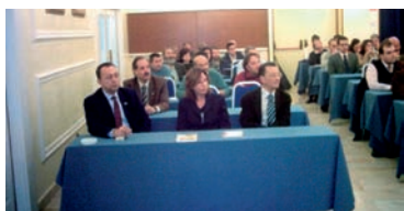
Delegados e invitados AHUGT-A