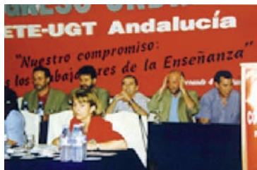
Detalle de la Mesa del Congreso AHUGT-A

San Fernando (Cádiz), 4 y 5 de junio de 1998