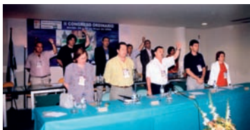
Clausura del Congreso AHUGT-A