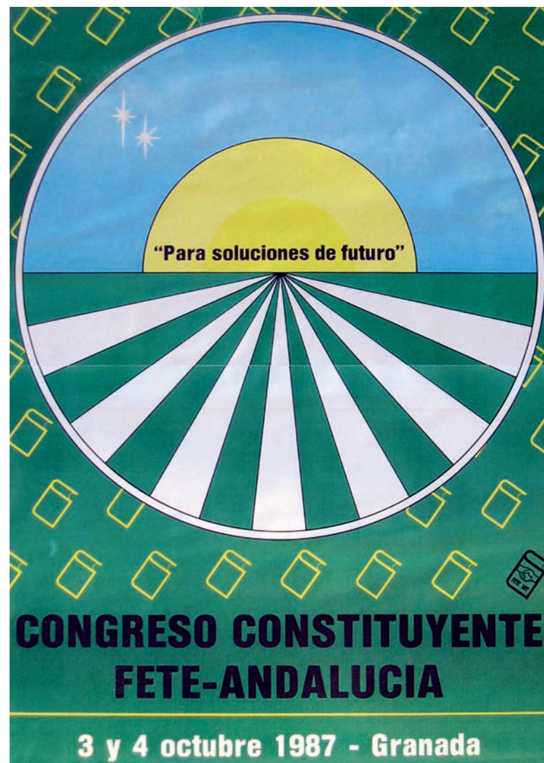
■ Cartel del Congreso Constituyente de FETE-Andalucía AHUGT-A