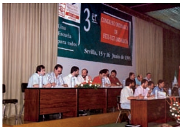
Mesa del Congreso AHUGT-A