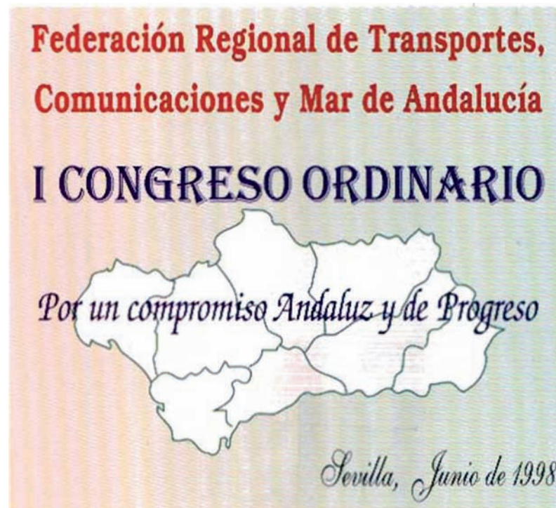
■ Cartel del I Congreso Ordinario de FTGM UGT-Andalucía