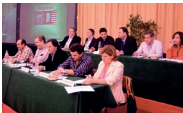
Mesa del Congreso AHUGT-A

Benalmádena (Málaga), 9 y 10 de noviembre de 2005