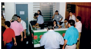
Reparto de credenciales AHUGT-A