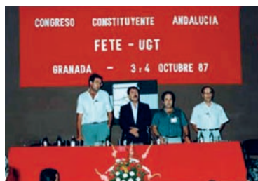
Mesa del Congreso AHUGT-A