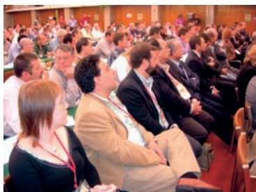
Delegados e invitados al Congreso AHUGT-A