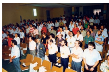
Delegados e invitados al Congreso Constituyente de FETE-A AHUGT-A