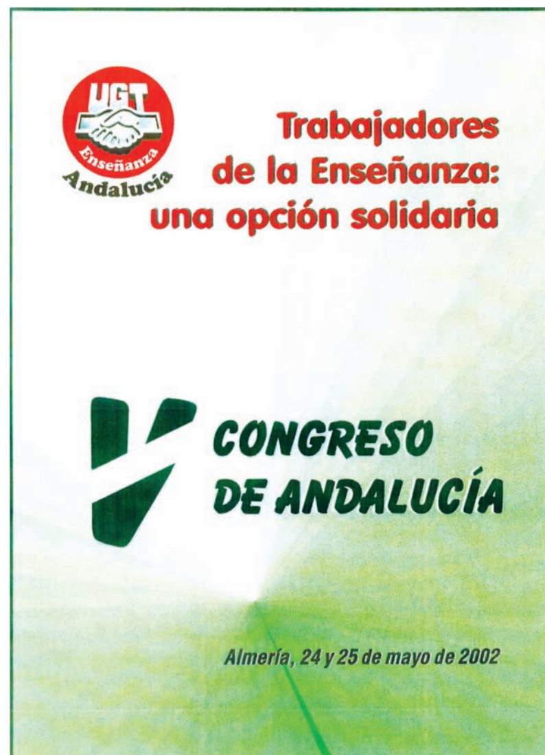
■ Cartel del V Congreso de FETE-UGT Andalucía