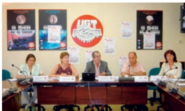
Algunos miembros de la nueva Comisión Ejecutiva, elegida en el VI Congreso AHUGT-A

La localidad de Benacazón (Sevilla) acogía, el 28 y 29 de junio de 2005, el VI Congreso Ordinario de FETE-A. La nueva ejecutiva quedaría constituida por: