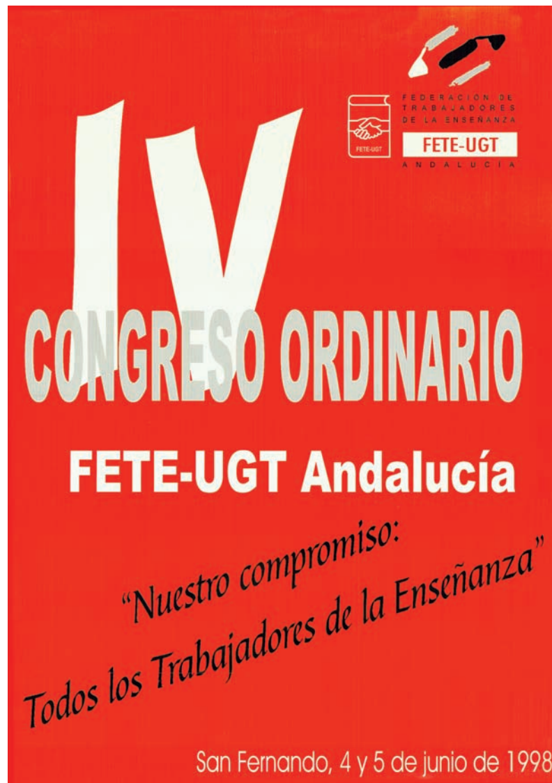
■ Cartel del IV Congreso de FETE-UGT Andalucía AHUGT-A CA1281