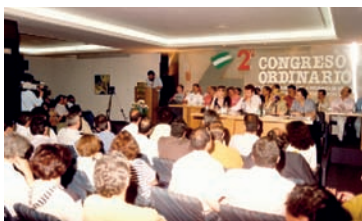
Vista general del salón de actos en el que se celebraba el II Congreso de FETE-A AHUGT-A