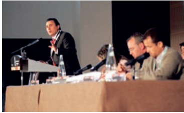
Imagen del IV Congreso de UPA-UGT Andalucía AHUGT-A