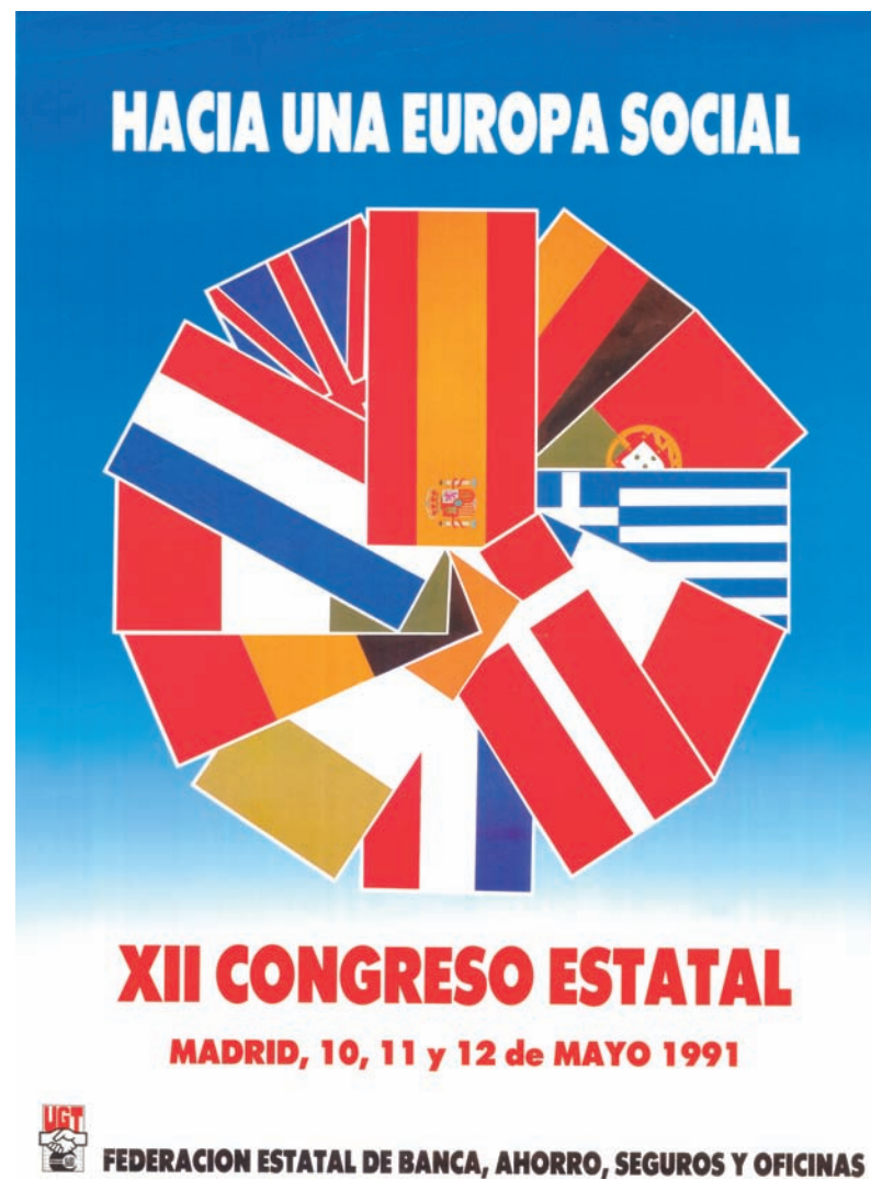
■ Cartel del XII Congreso de FEBASO AHUGT-A Original en la FFLC

Al cierre de esta edición no podemos ofrecer la composición de la Comisión Ejecutiva elegida en este Congreso.