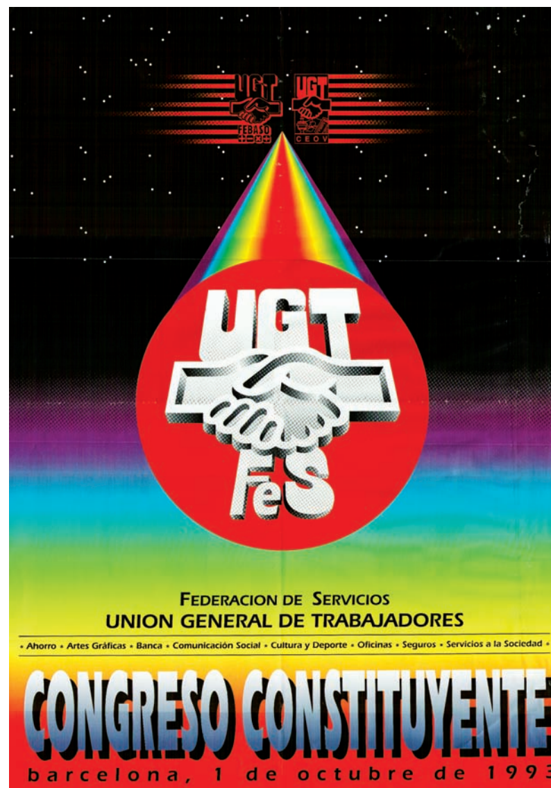
■ Cartel del Congreso Constituyente de la FES AHUGTA

Al cierre de esta edición no podemos ofrecer la composición de la Comisión Ejecutiva elegida en este Congreso.