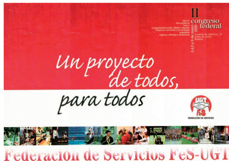
■ Cartel del II Congreso de FES AHUGTA

Al cierre de esta edición no podemos ofrecer la composición de la Comisión Ejecutiva elegida en este Congreso.