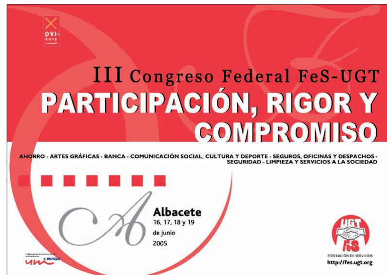
■ Cartel del III Congreso de FES AHUGT-A