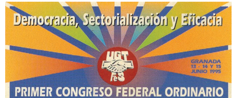
■ Cartel del I Congreso Federal Ordinario de FES AHUGT-A