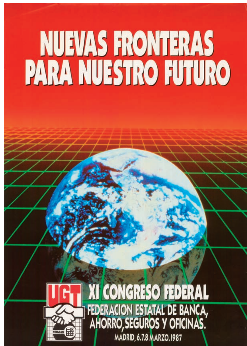
■ Cartel del XI Congreso de FEBASO AHUGT-A Original en la FFLC

Al cierre de esta edición no podemos ofrecer la composición de la Comisión Ejecutiva elegida en este Congreso.