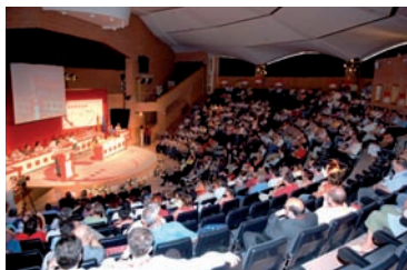
Vista general del Congreso FES