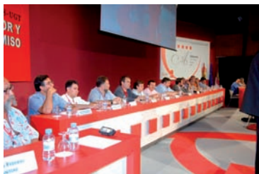
Mesa del Congreso FES

Albacete, 16, 17, 18 y 19 de junio de 2005