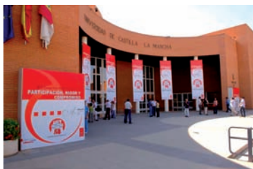
La Entrada al Congreso FES