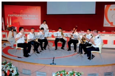
Clausura del Congreso FES

La Ejecutiva Federal elegida en este Congreso estaría constituida por: